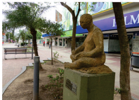
Escultura en la peatonal de Resistencia

La colectividad italiana emplazó las primeras esculturas en la ciudad que ella misma contribuyera a fundar. Como ejemplo bástenos mencionar el monumento a la Loba Romana, inaugurado el 20 de Septiembre de 1920 conmemorando el 50° aniversario de la República italiana en la plaza central de la ciudad. Luego, en las décadas de 1930 y 1940 se continuó con la erección de esculturas en recuerdo a distintos