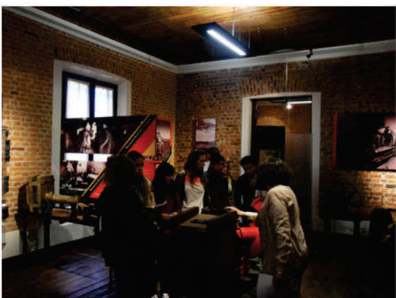
Alumnos de UCALP en el Museo

Se trata de un espacio público lindero al Museo del Ladrillo que debió ser cedido al Municipio luego de una modificación a la zonificación del área cuando el predio de la antigua fábrica fue alquilado a una multinacional para la instalación de un supermercado. La plaza no cumplió su propósito y cayó en el olvido por más de 15 años. Pero la situación comenzó a revertirse con la declaración por parte del Concejo Deliberante del nombre otorgado a la misma: "Plaza Ing. Francisco Ctibor".