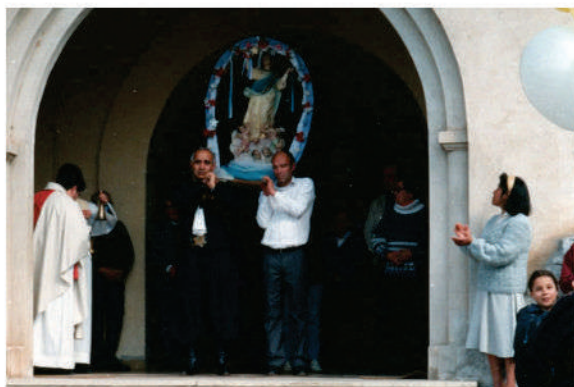
Fiestas patronales

El cronograma incluye no sólo las actividades de las autoridades eclesíásticas y sino también de las áreas de Turismo, Deportes y Cultura de Anisacate; las instituciones educativas, la Biblioteca Flavio Arnal Ponti, el geriátrico Solaire, las Agrupaciones Gauchas, los artesanos y microemprendedores de la zona.