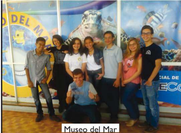
Museo del Mar