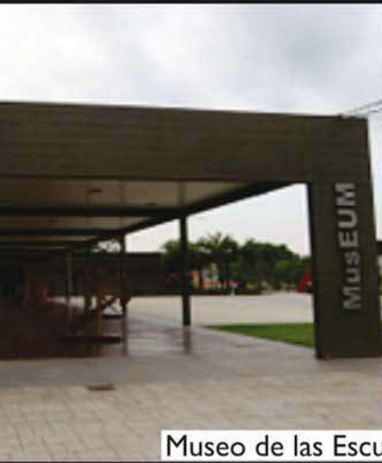
Museo de las Esculturas Urbanas del Mundo