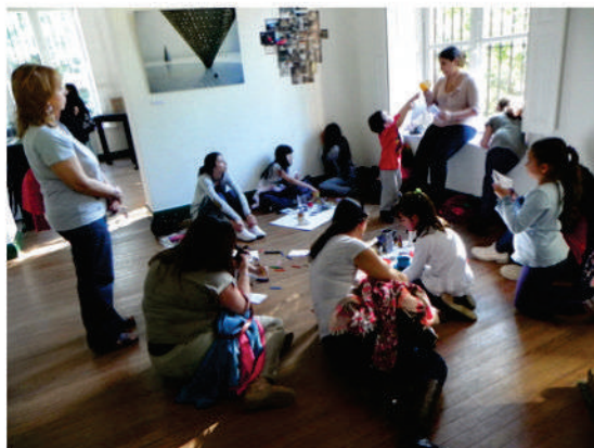
Actividades en familia. Mundo Hogar

de los distintos públicos. Para ello armaríamos colecciones temáticas que facilitarían al visitante asomarse al arte contemporáneo, a su diversidad de miradas (románticas, reflexivas, formalistas, sensuales, críticas), modos de expresión, soportes y procedimientos.