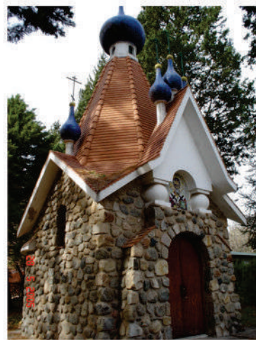
Imágen de la Capilla ortodoxa