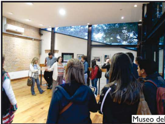
Museo del Ladrillo