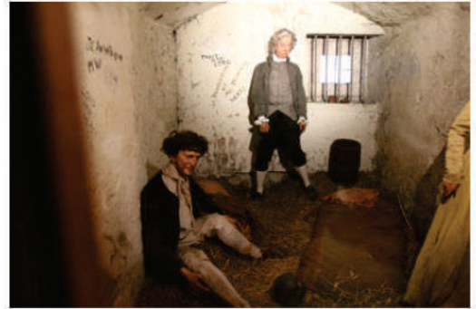
Celda en un Tolbooth

impuestos, prostitutas, borrachos y rateros o criminales en general alojados en celdas sin distinción de sexo, edad o delito cometido. Estaban en los lugares más inaccesibles del edificio, podía ser en un sótano a un