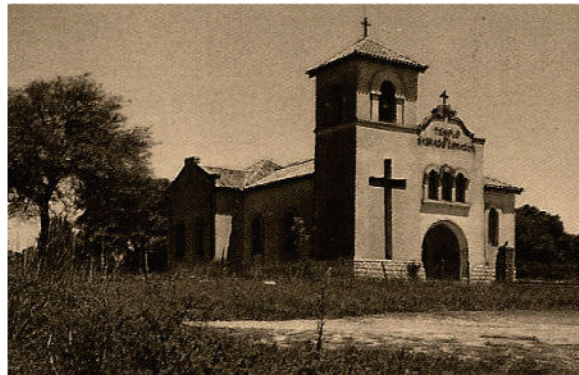
Vista actual de la Capilla Sagrado Corazón

Para explicar el por qué de la elección, algunos la basan en el valor como " símbolos de la religión de cada uno... "; otros como atractivos ya que " ... mucha gente viene a ellas " o porque " ... la iglesia es muy importante!!! Es lo que une a los católicos... " Algunos refieren: " ...Somos muy creyentes, todos los domingos vamos a misa, festejamos Pascua, y hacemos todo lo que pide la iglesia... "