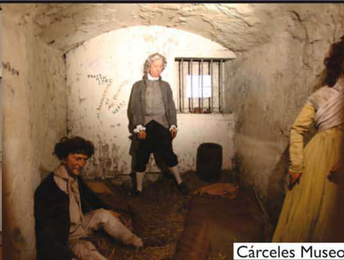
Cárceles Museo en Escocia