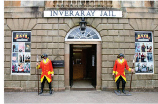
Cárcel Museo Inveraray Jail

En Escocia se pueden visitar muchas Cárceles Museo, que relatan una arquitectura carcelaria que va de la mano con la evolución (muy lenta) del trato al penado o al "criminal" que iba a ser castigado.