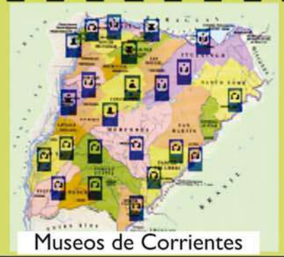
Museos de Corrientes