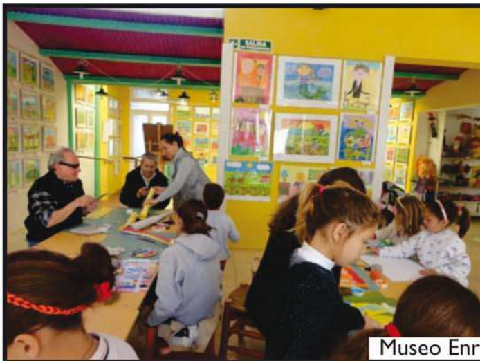
Museo Enrique Urcola