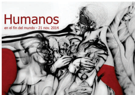
Memorias, de Luis Demairos Moura.

En este momento se encuentra en exhibición en las salas del Museo la muestra "Humanos en el fin del mundo", organizada colectivamente por artistas de la ciudad de Ushuaia, y cuenta con más de 200 obras de alrededor de 130 artistas de la Provincia, del país y de fuera de la Argentina.