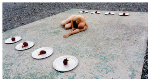
Banquete en Antártida, de Kenneth Colorado. Instalación