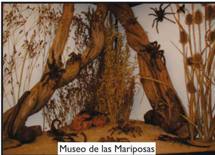
Museo de las Mariposas