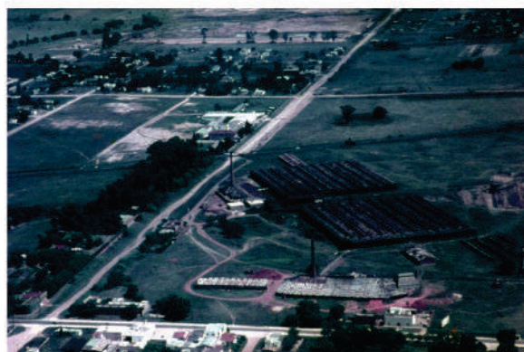
Antigua fábrica de Ladrillos F. CTIBOR. Área de intervención

El proyecto alcanzó, en 2014, una mayor dimensión ya que se propuso la integración de otros componentes de la antigua fábrica, deviniendo en una revalorización de toda el área que, a modo de paseo, pretende concluir en un antiguo horno que se quiere restaurar con fines culturales. A fines de 2015 se espera poder presentar la propuesta a las autoridades municipales.