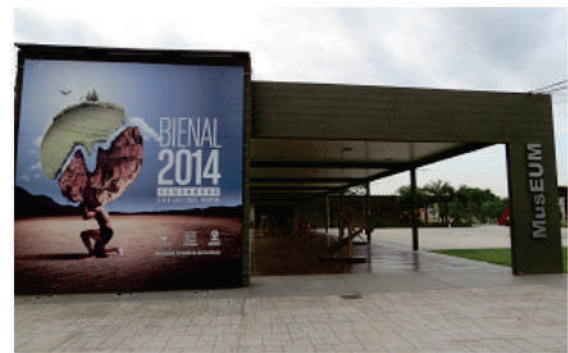
Ingreso al MusEUM a través de la galería abierta de exposiciones.

6- la Rambla de las Esculturas, habilitada a lo largo de los 500 metros de la Avenida de los Inmigrantes. Éste último lugar, el parque y las galerías, son de libre acceso todos los días del año y a toda hora.