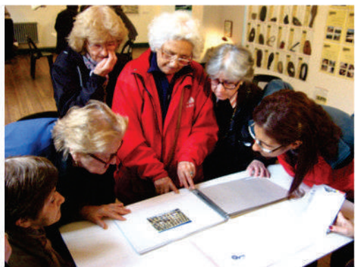
Exposición de arte correo: Buen Viaje!