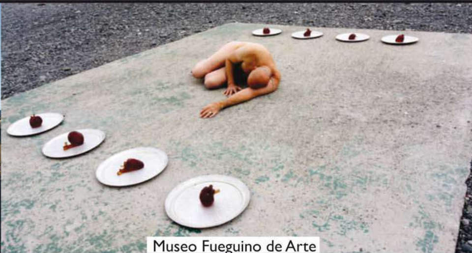
Museo Fuegoño de Arte