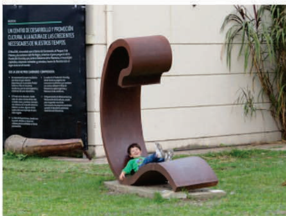
Convivencia cotidiana de la sociedad con las esculturas.

transfiguración de una ciudad -que si bien vivía el arte no se acercaba a la magnitud actual- en cada cuadra por la que transita. Y no solo lo ve, sino que también lo identifica, lo percibe, se apropia del mismo. ¿Cómo no hablar entonces de identidad? Podemos afirmar, sin temor a equivocarnos, que las esculturas ya son parte de un paisaje cultural urbano, arraigado en la historia de la ciudad de Resistencia y en cada uno de sus habitantes.