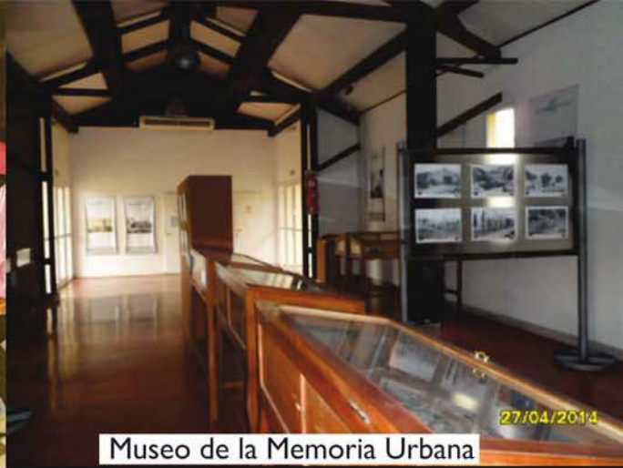
Museo de la Memoria Urbana