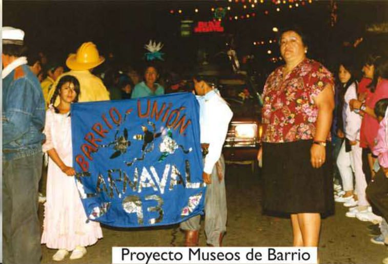
Proyecto Museos de Barrio