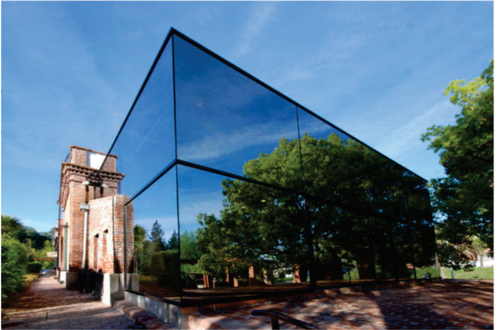
Museo del Ladrillo

En esta última línea de acción, podríamos clasificar las experiencias en dos tipos, externas e internas: aquéllas que se dieron por la elección del Museo como objeto de estudio desde distintos ámbitos educativos y aquéllas que surgieron como propuestas internas asociados con una institución educativa, a través de