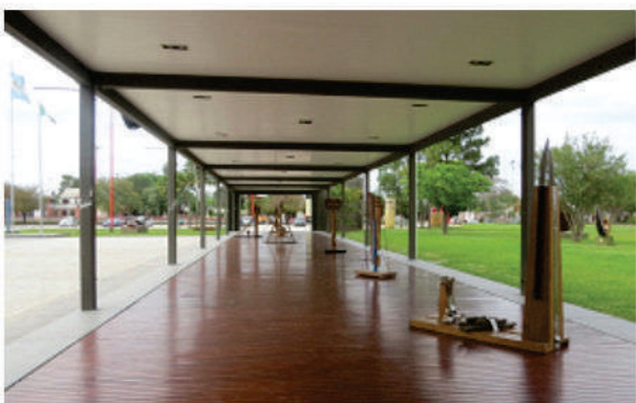
Galería Abierta de Exposiciones en el MusEUM.

El espacio urbano se fue jerarquizando poco a poco, y la sociedad de Resistencia profundizó su sentido de pertenencia y fue fortaleciendo su identidad compenetrada con las más de 600 esculturas distribuidas por sus calles y espacios verdes.