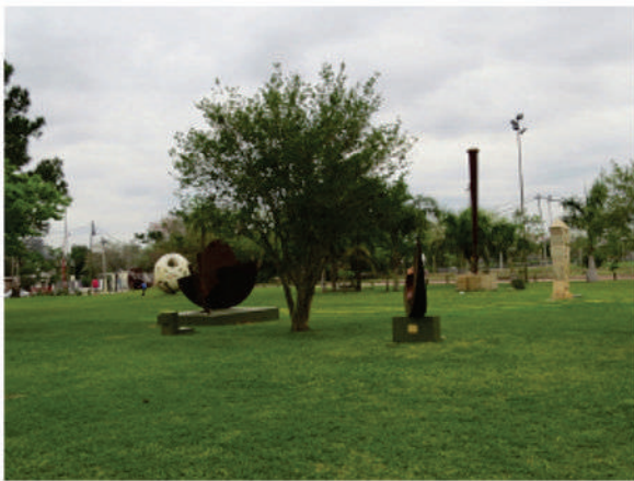
Esculturas de gran tamaño emplazadas en el parque del MusEUM.

Las esculturas forman parte indisoluble de la identidad de la ciudad y sus habitantes, que no visualizan un tiempo en el cual no estuvieron donde están y ocupan