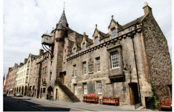
Edimburgo. Town House

cobro de impuestos y que también podía llegar a cubrir el cargo de Sheriff. Allí iban a parar deudores (debtors) de