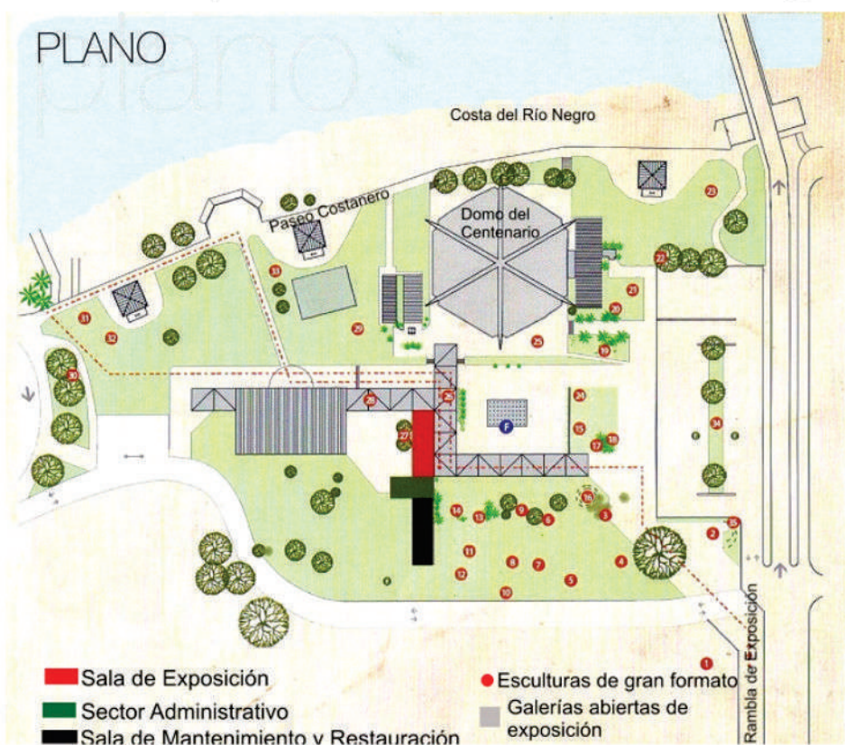
Croquis del predio del Domo y el MusEUM