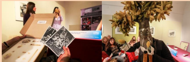
III Encuentro Nacional de Formación de Educadores de Museos organizado por CECA-ICOM (Alta Gracia – Septiembre 2017)

Para finalizar, desde ambos espacios, la “educación formal” y la “educación no formal”, se debe contar con profesionales capacitados para crear puentes y lazos que permitan este diálogo que es único e individual, porque cada visitante es “único” y la visita al museo es una experiencia que tendrá un resultado positivo cuando se logre un equilibrio entre lo ritual y lo lúdico.