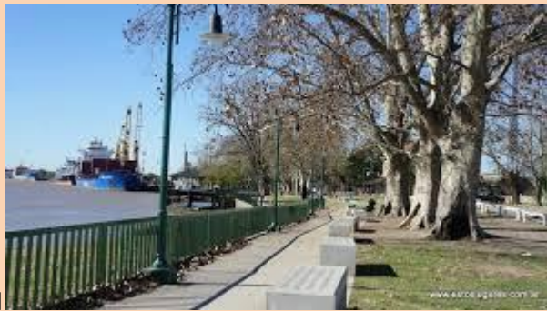
Imagen del Paraná de las Palmas

En el caso concreto de la ciudad de Campana hay un potencial muy valioso para explotar, el río, las islas, la reserva, los museos, las empresas, las estancias, la arquitectura, su historia y un exquisito patrimonio intangible. Ubicada estratégicamente sobre la ruta Panamericana cada vez tiene más posibilidades de crecer como destino de turismo de reuniones. La belleza del Delta, la Reserva Natural de Otamendi, el trazado de la ciudad obra de Carlos de Chapeaurouge, sus museos Ferroviario y del Automóvil, transforman a Campana en un destino muy particular en franco crecimiento a solo 75 km de distancia de la Capital Federal.