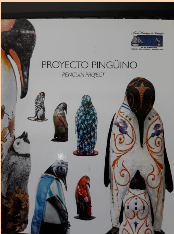
Tapa del Libro Proyecto Pingüino realizado por el Museo Marítimo de Ushuaia.