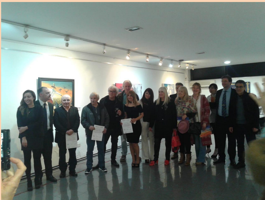
24 años del Museo y Archivo del Servicio Penitenciario de la Prov. de Buenos Aires