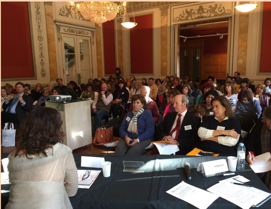
Sala del Palacio Ferreyra en el Encuentro Federal ICOM FADAM ADIMRA Córdoba Junio 2018