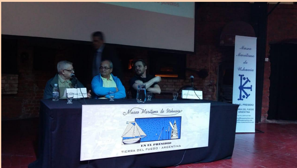
Panel en el Museo Marítimo de Ushuaia