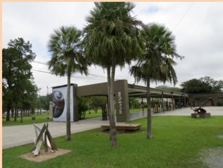
MusEUM de Resistencia: ejemplo de participación comunitaria e identidad.

En la ciudad de Resistencia, provincia del Chaco, encontramos un ejemplo: el Museo de las Esculturas Urbanas del Mundo, creado en 2006 y gestionado por la Fundación Urunday, constituye un centro de irradiación cultural –desde su sala cerrada de exposición, hasta las galerías abiertas, el parque de las esculturas y la rambla que se extiende desde el Domo del Centenario hasta la avenida Lavalle- y pudo lograr, con trabajo y esfuerzo, que la sociedad se apropie de su espacio. Y además, hoy en día, forme parte incuestionable de la identidad de la ciudad de Resistencia, con una comunidad que participa e interactúa en forma masiva en el evento más importante y trascendente que tenemos los chaqueños: la Bienal Internacional de Esculturas.