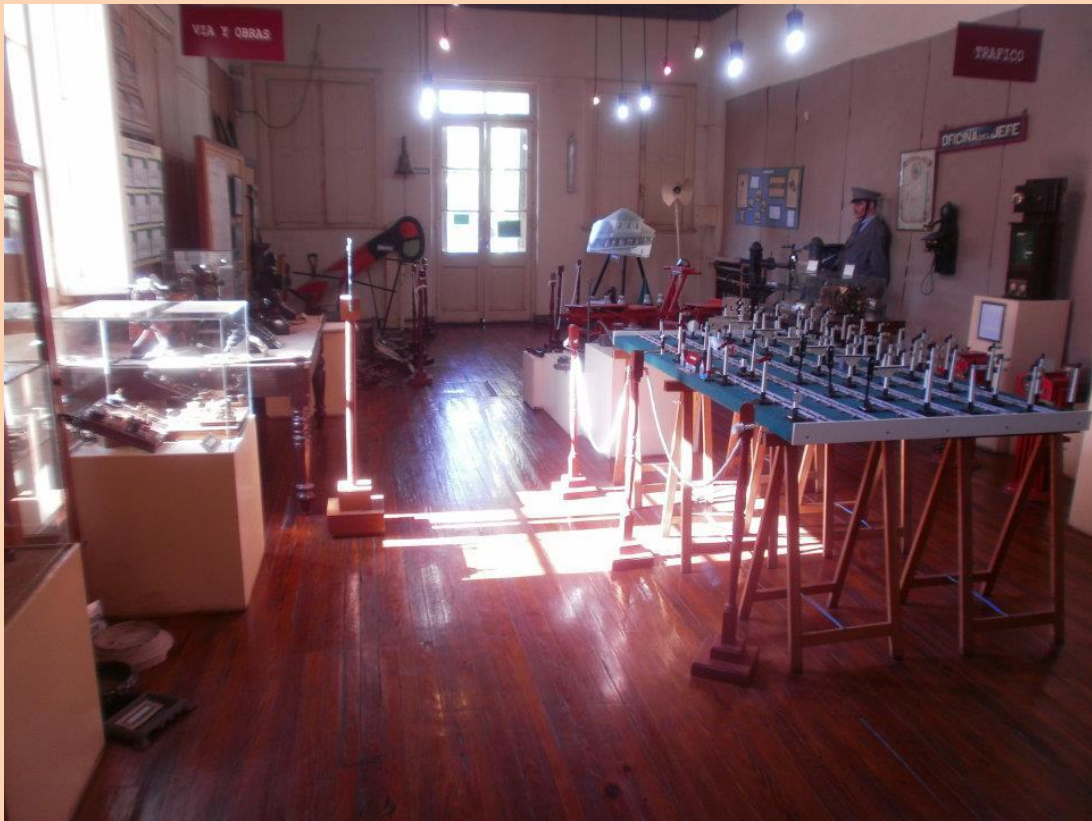
Museo Ferroviario "V́ctor L. Capusso"