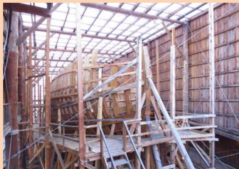
La nao San Juan, tomando forma. Un proyecto comunitario y participativo.