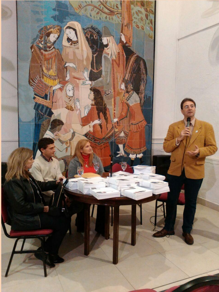
Presentación de la Guía de Museos de la Región Capital- La Plata, Berisso, Ensenada y Magdalena.