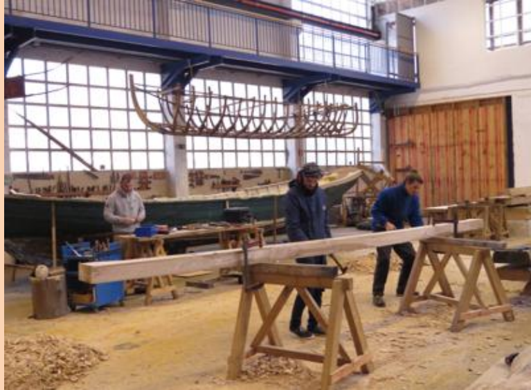
Museo Albaola, en Gipuzkoa, País Vasco. Voluntarios construyendo una réplica de la nao San Juan para realizar travesía a Canadá.

En ésta última línea citamos el ejemplo del Museo Albaola de la localidad vasca de Pasai San Pedro, en el cual, además de permitir la observación de sus colecciones que relatan la historia marítima de su pueblo, la comunidad puede aprender desde carpintería naval, navegación, modelismo y artes escénicas, hasta participar como voluntario en la construcción de la nao San Juan con