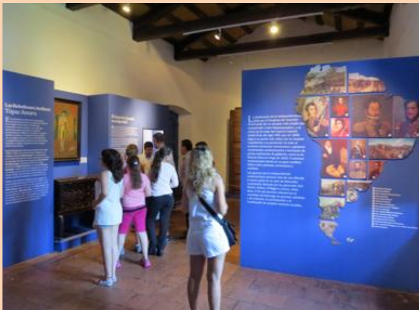
Ejemplo de democratización cultural en la Casa Histórica de Tucumán en el cambio de guión en 2015.

Hasta hace unas décadas, estas instituciones constituían espacios solemnes, en los cuales se ponía a disposición de la comunidad sus colecciones y se realizaban actividades de extensión para distintos sectores. El público era, en definitiva, un consumidor pasivo que participaba de una agenda diagramada por las autoridades, que decidían desde el armado de un guión museológico y su discurso, la estética de exposición, las actividades a realizar