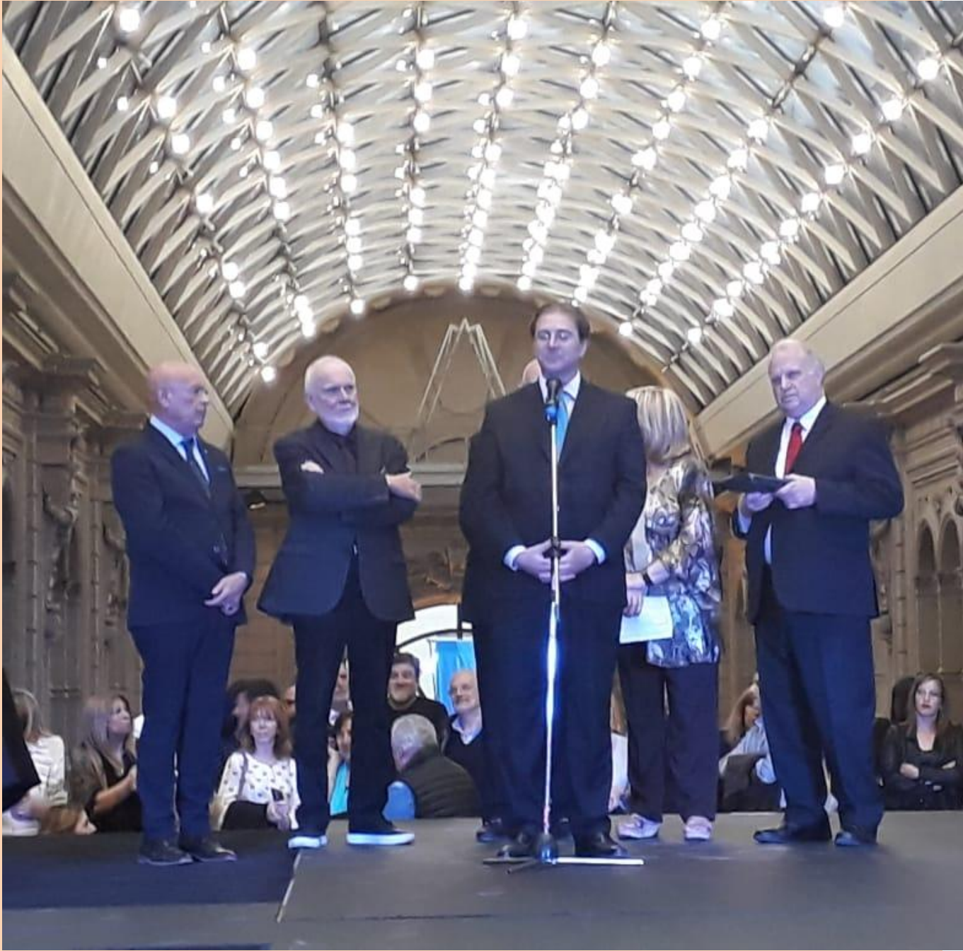
Presentando la IV Bienal Internacional de Arte en el Centro Cultural Borges