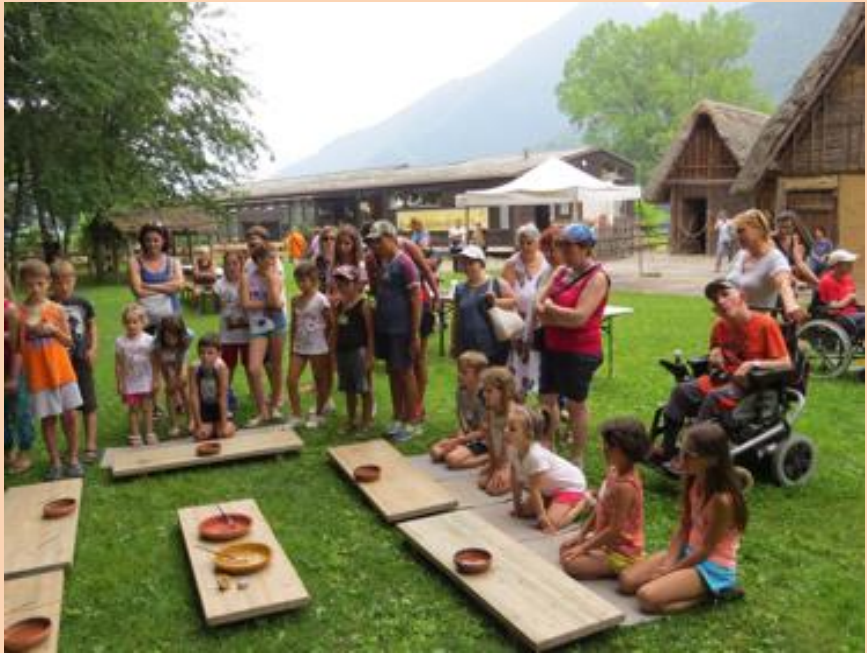
Participación comunitaria e integración social

Entre los proyectos que llevan a cabo, podemos mencionar: SyCULT, Convenio entre productores y restaurantes destinado a promover el uso de hierbas medicinales, 'Las raíces de la cooperación' que consiste en recuperar fachadas de viviendas históricas, 'Banco de la memoria': investigación histórica, censos de puentes de viviendas, etc.