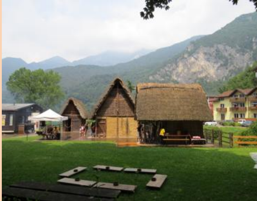
Ecomuseo della Judicaria. Valle del Ledro. Norte de Italia.

coleccionistas y tradicionalistas y con poca o nula actividad; 2- Museo conductista-semi estático-semi autoritario: centran su actividad a las exposiciones que son diagramadas por sus autoridades y realizan contadas acciones culturales que en muchos caso no tienen que ver con la temática del museo, y el rol del visitante se limita a ‘ver y escuchar’ y la función educativa es