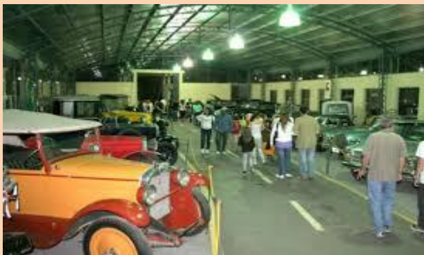
Museo del Automóvil "Manuel Iglesias"