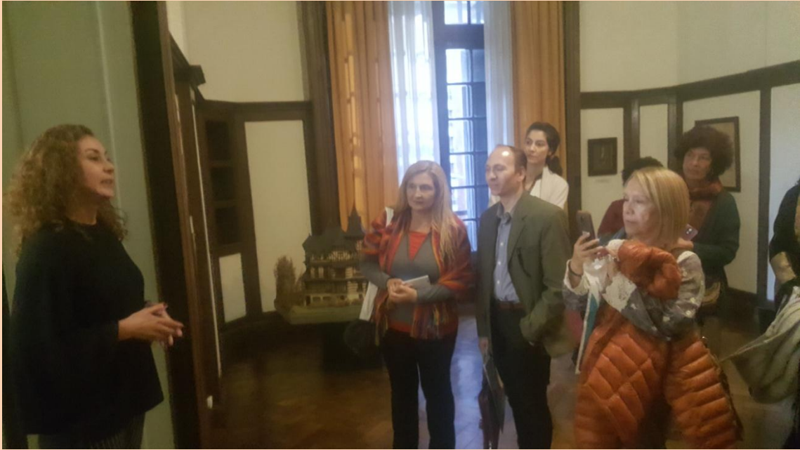
Visita guiada al Museo Castagnino