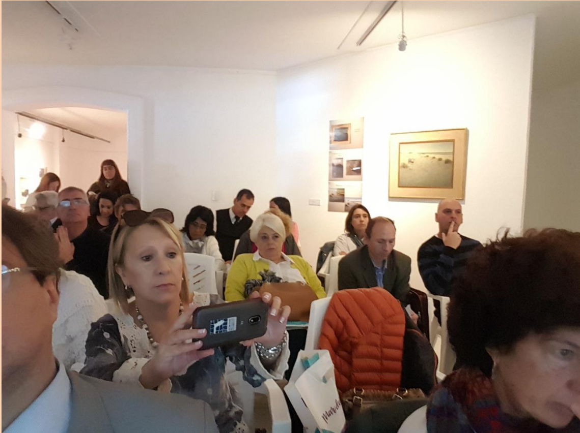
Asistentes al 53° Encuentro