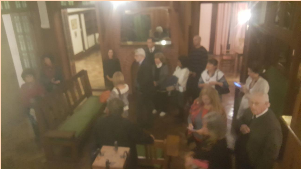
Recorriendo la Villa Ortiz Basualdo, Museo Castagnino