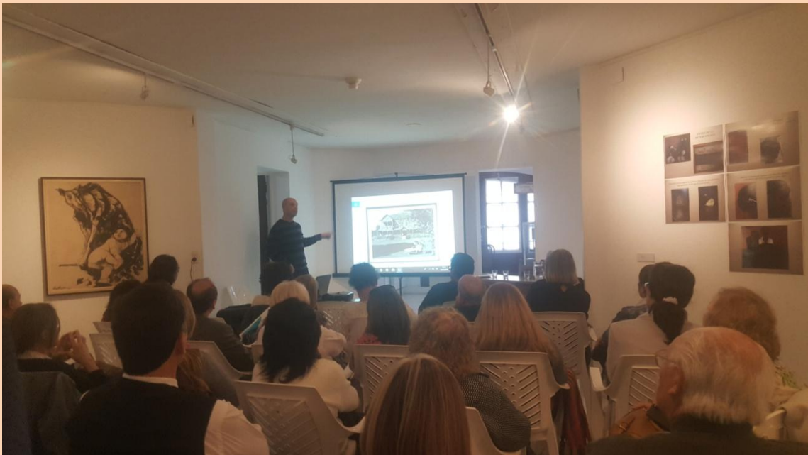
Una de las Conferencias, sobre Villa Victoria y la sustentabilidad en la restauración de la casa, durante el 53° Encuentro.