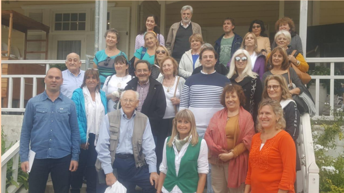
Grupo de directores visitando la Villa Victoria

Fotos del 53° Encuentro Nacional de Directores de Museos en Mar del Plata, realizado en el Museo Castagnino 12 y 13 de Abril de 2019