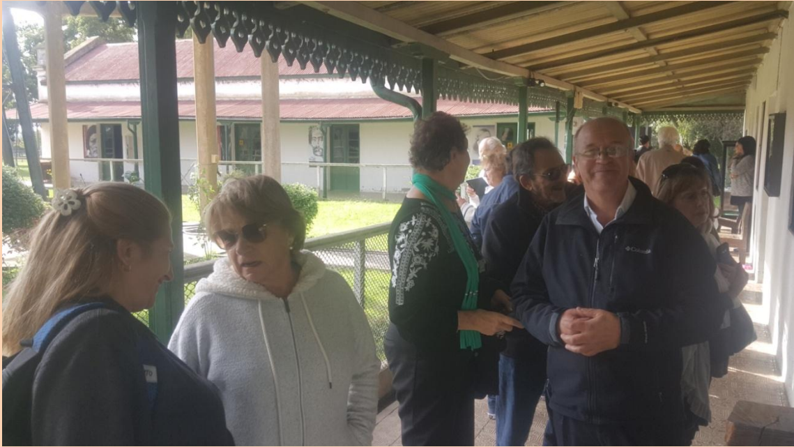
Recorriendo el Museo José Hernández