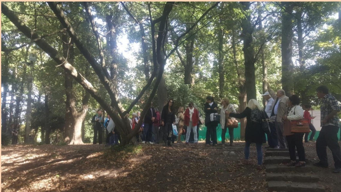
Recorriendo la Casa del Arroyo.