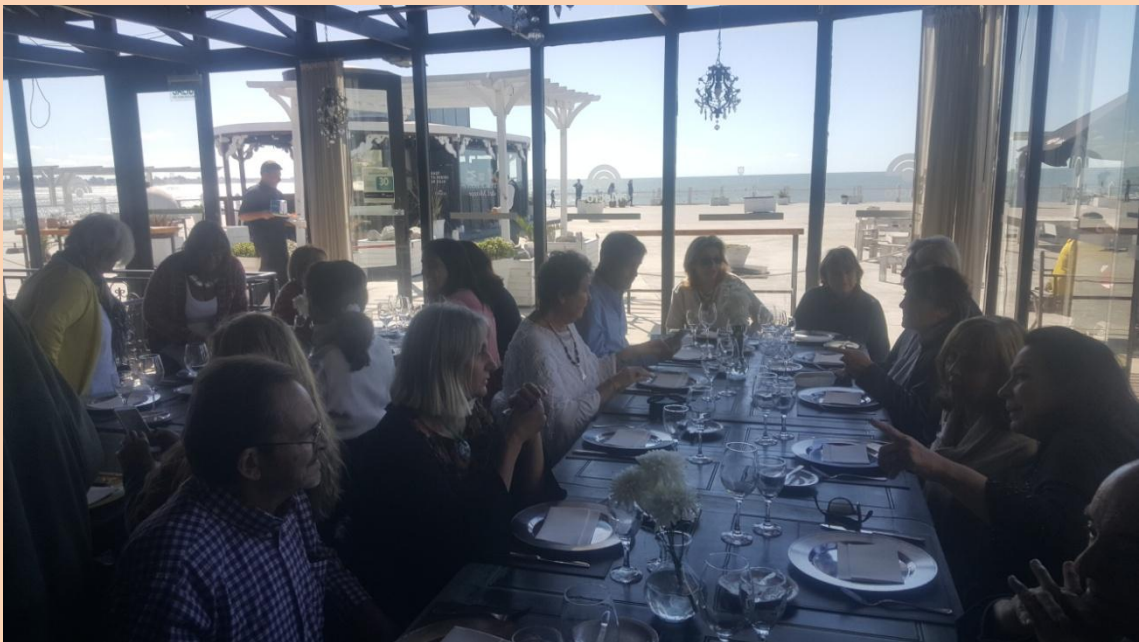
Almuerzo de Camaradería en el Torreón.